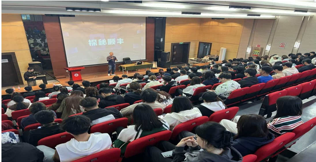
图 13 企业教师进课堂开展培训

校企教师团队依据岗位工作过程和岗位能力进行教学设计，不仅将快递岗位真实工作项目引入课程。《物流仓储管理》课程被评为辽宁省 2021 年精品在线开放课程，在学堂在线平台开放四期，国内外 2557 人学习。并且将价值观引领、职业精神培养融入课程，提升学徒实践技能的同时，培养敬业、精益、专注、创新的工匠精神。