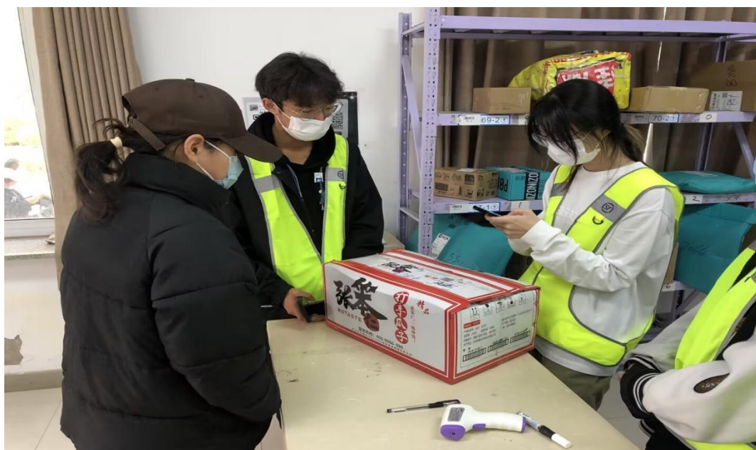
图7 学生在校内顺丰站点实习

第一阶段：认识学习阶段（基础岗位）。 培养目的：通过现场宣讲及学徒平时在校内顺丰站点（校企共建生产型实训基地）的学徒身份学习，基本了解快递营运流程。入岗时间：第一学期至第二学期，每学期连续3周+课余时间。