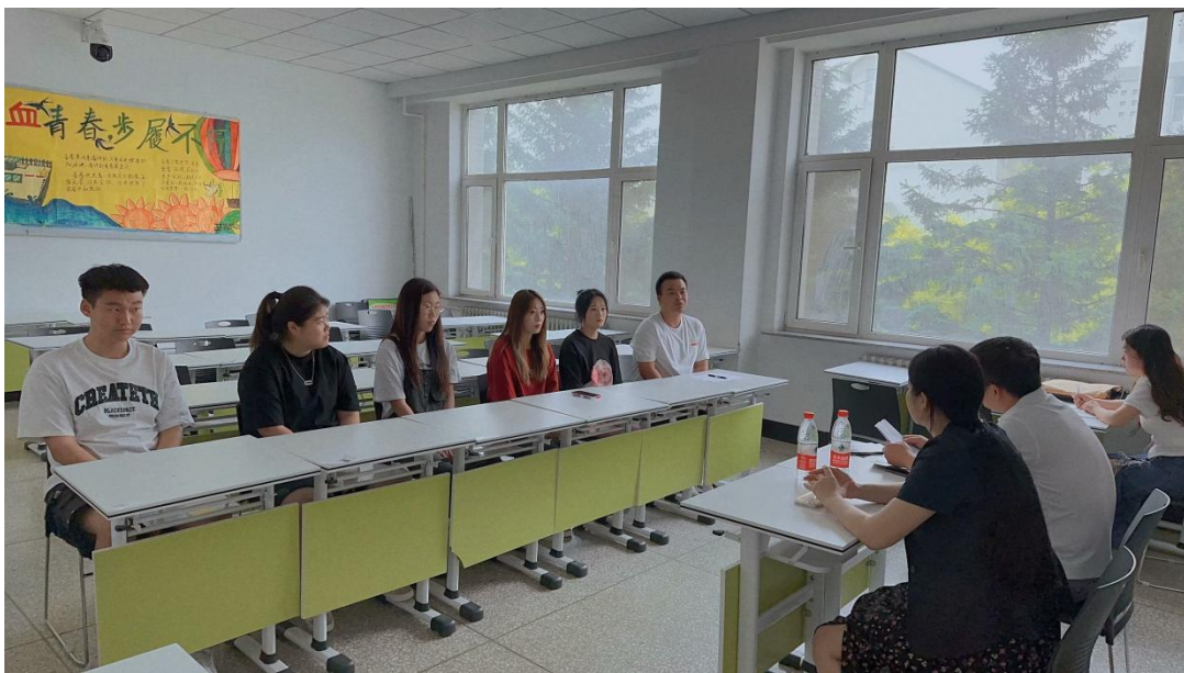
图 12 顺丰订单班招生面试现场

在新生报到两周内，组织开展报名工作。由现代物流管理专业、招生就业处、顺丰人力资源部组成招生招工考试领导小组。通过笔试与面试，被录取的学生既是学校学生又是企业学徒，按现代学徒制专业人才培养方案进行人才培养。