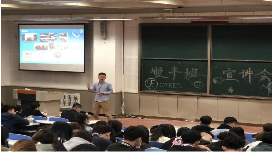
图 11 顺丰订单班招生宣讲会