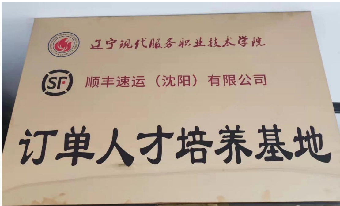
图1 校企合作订单人才培养牌匾