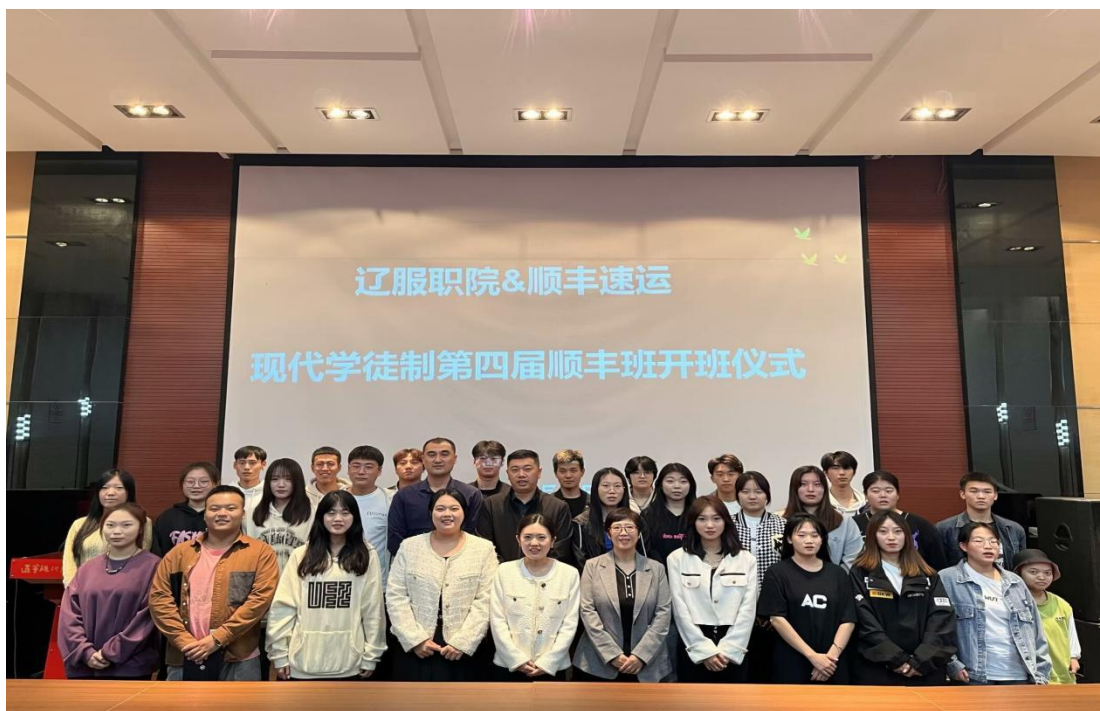
图6 第四届顺丰订单班开班仪式