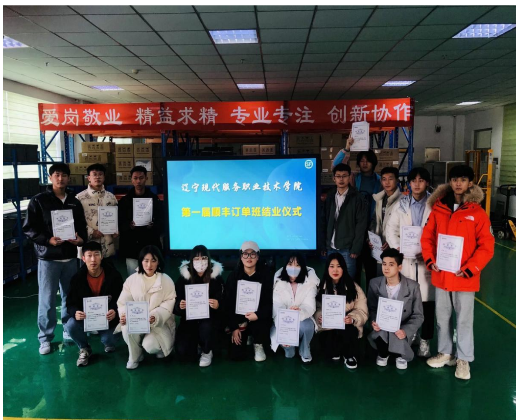
图5 第一届顺丰订单班结业仪式

在多年的发展过程中，顺丰速运与辽宁现代服务职业技术学院现代物流管理专业达成深度合作关系。2020年成立顺丰速运订单班，通过开展学生面试录取选拔，已经有2019--2022四届订单班，共计106人。顺丰速运积极参与顺丰订单班人才培养，定期派企业导师到学校开展业务培训，并在校内快递站点开展工学结合式人才培养，并于最后一个学期安排订单班学生到企业跟岗、顶岗实践，学生在真实工作情景中，学习快递业务技能和运营管理知识。2019级、2020级、2021级同学按照自愿原则，到顺丰速运开展毕业实习，每年有80%的学生入职顺丰速运，已经形成现代学徒制人才培养模式。