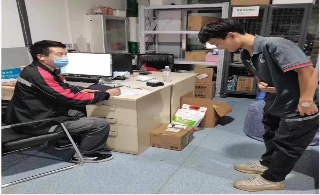
图8 学生在顺丰站点拜师傅

第三阶段：学徒顶岗阶段（核心岗位）。 培养目的：通过学徒在校内外顺丰站点顶岗工作，让学徒承担快递业务员、仓管员等工作职责及强化专业技能，更深入地了解快递行业的操作，使学徒具备基本岗位工作能力和职业素养。入岗时间：第五学期，连续8周。