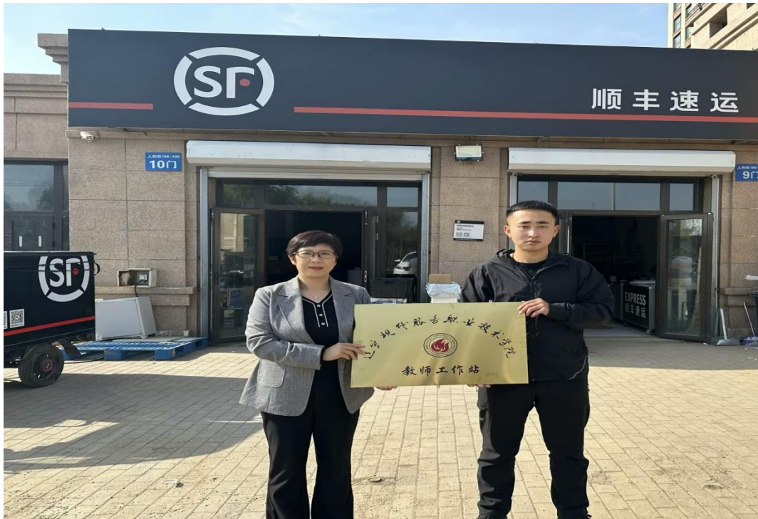
图3 校企共建教师工作站