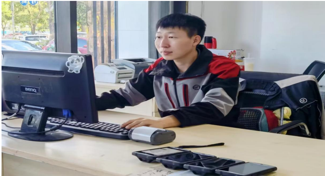
图 10 学生在顺丰站点仓管员岗位实习